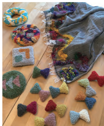
Designed by Nao

JAN:4974723416133 品番:TK-002 品名:ラグフック 入数:1本 価格:2,310円(税込) パッケージサイズ:28mm×170mm×20mm 推奨糸:毛糸(中細～極太用)