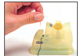
②針をセットする (ストンと落とします。)