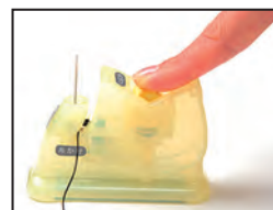
③ボタンを押す (ゆっくりとボタンを押します。)