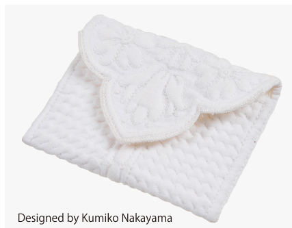
Designed by Kumiko Nakayama