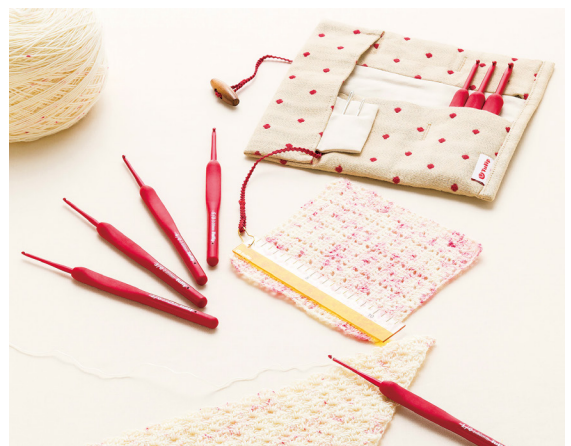
Designed by Kazuko Murabayashi